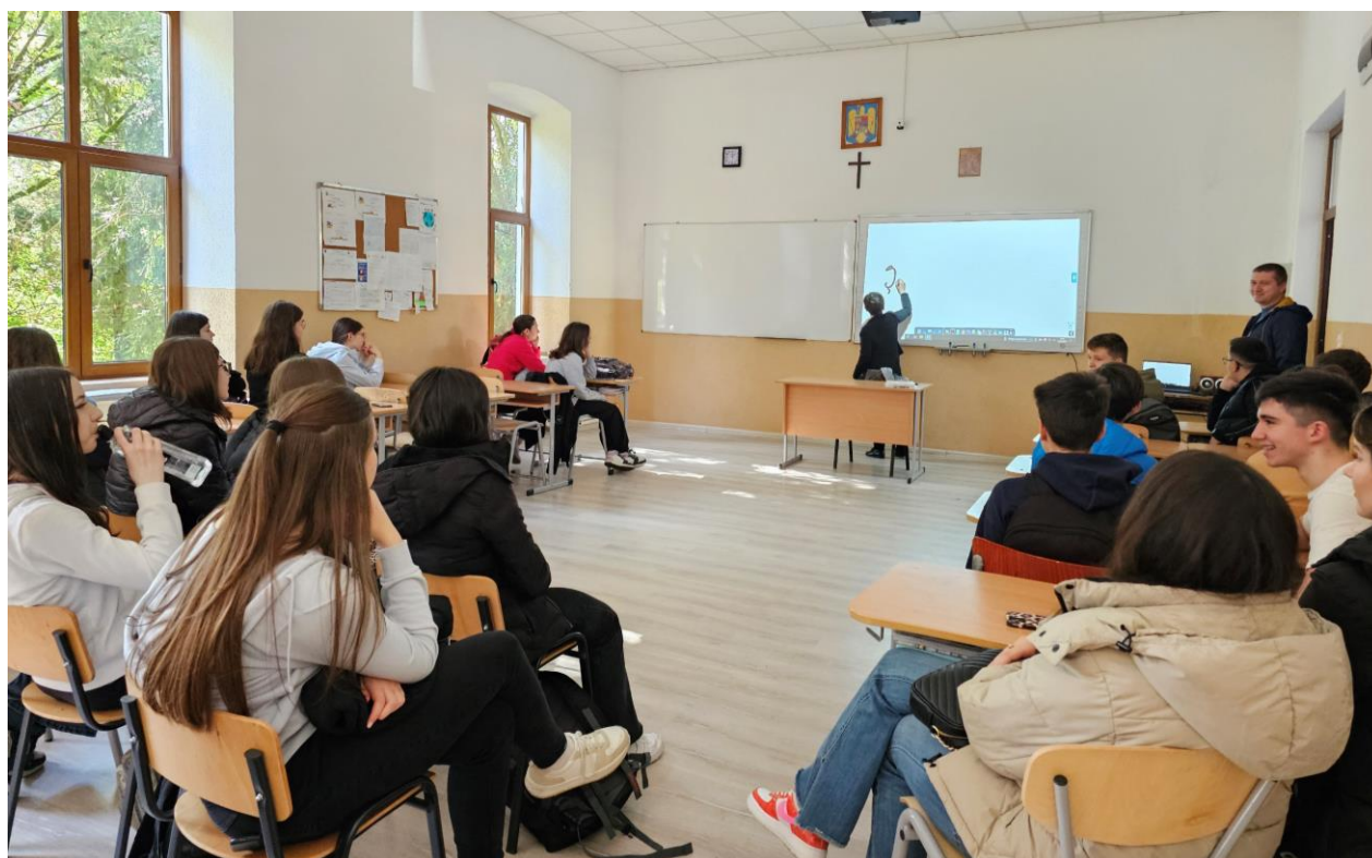
LICEUL TEHNOLOGIC „ȘTEFAN MANCIULEA” BLAJ și LICEUL TEOLOGIC „SFÂNTUL VASILE CEL MARE” BLAJ