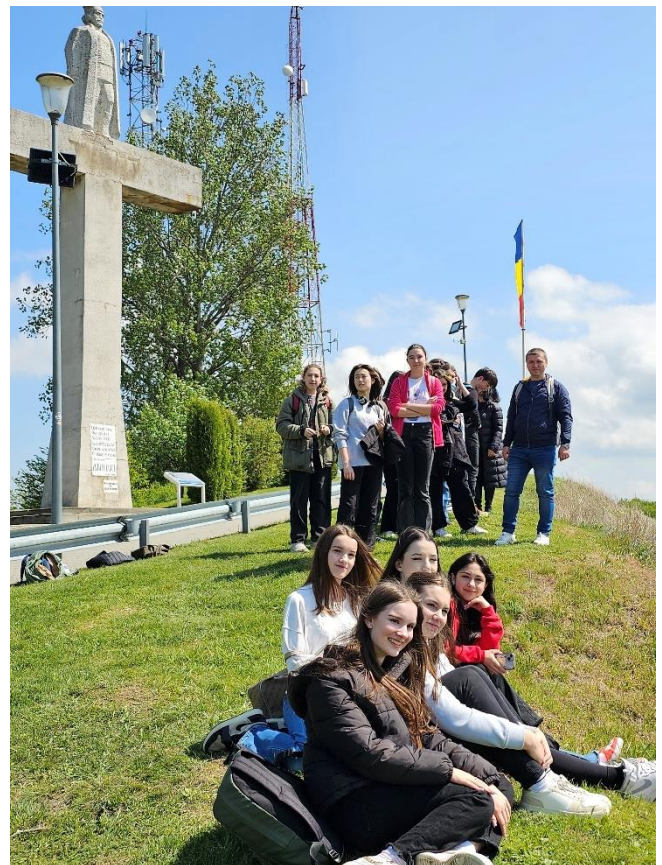
TEIUL LUI EMINESCU și CRUCEA LUI AVRAM IANCU