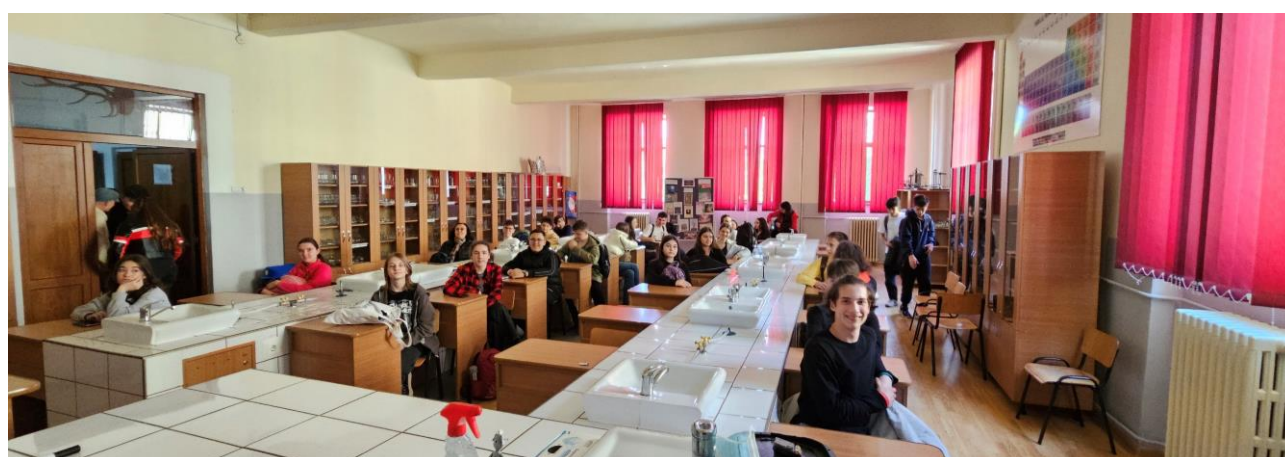
COLEGIUL NAȚIONAL „I.M. CLAIN” BLAJ